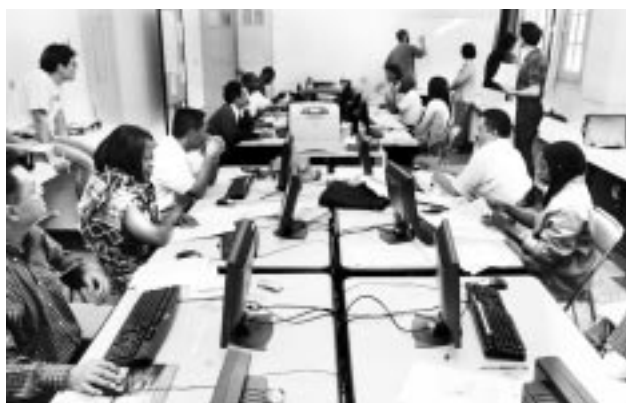
Figure 1 - Installation de la salle de formation. Chaque apprenant dispose d'un ordinateur connecté par réseau à Internet. Ici, les apprenants présentent le plan de leurs exposés en séance plénière dans un cadre de co-animation impliquant les apprenants et les facilitateurs. La disposition des postes de travaux participe à l'instauration d'un esprit de groupe (Atelier Paludisme, session 2005).

- sur une dynamique de groupe parmi les apprenants qui s'est dessinée au cours des semaines. Cette dynamique a été très palpable par les facilitateurs qui ont exercé en fin d'atelier. Au-delà de l'auto-apprentissage et des échanges