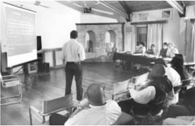
Figure 2 - Soutenance des exposés devant le jury. Les séances de soutenances ont eu lieu en fin de semaine devant les apprenants et le jury composé des facilitateurs. Ces séances permettent aux apprenants de mettre en valeur les acquis en défendant leur démarche, et visent à évaluer le travail réalisé dans la semaine (Atelier Paludisme, session 2006 ; crédit photographique) (© Olivier Domarle).

minateurs évaluant leur travail et leur prestation (Fig. 2). Cet examen en séance plénière incite les apprenants à donner le meilleur d'eux-mêmes. Les cycles hebdomadaires se terminent par un entretien individuel des apprenants avec tous les facilitateurs de la semaine pour établir un bilan en identifiant les acquis et les faiblesses.